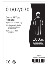
EXEMPLO DE APRESENTAÇÃO