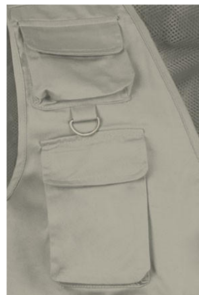
Detalhe bolso e anel no peito superior direito