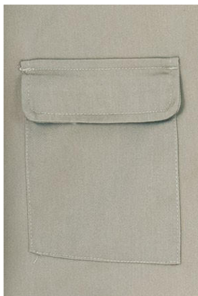
Detalhe bolso inferior traseiro com pala