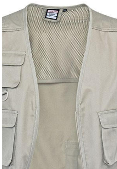
Detalhe rede interior nas costas, zona superior