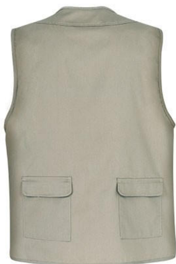
Vista parte traseira da peça (costas)